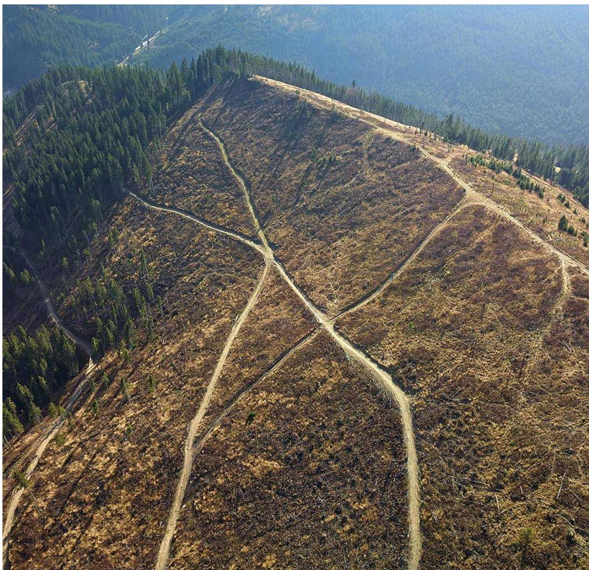
Tăieri la ras în Parcul Natural Maramureș, sit Natura 2000

împădurirea este sortită eșecului dacă nu se abordează problema tăierilor de pădure și corupția